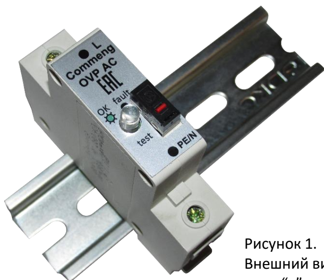
Рисунок 1. Внешний вид мод. "v"

Commeng OVP-2L AC 280/15 устройство защиты от импульсных помех (УЗИП), предназначенное для защиты одно- и трехфазных электроустановок и цепей питания переменного тока 220/380 (230/400) В от импульсных перенапряжений. Внешний вид устройства показан на рис.1, функциональная схема на рис.2., основные технические характеристики приведены в таблице.