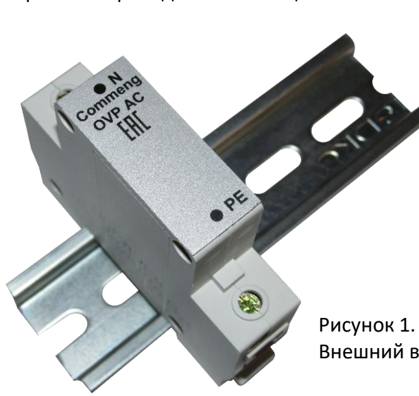
Рисунок 1. Внешний вид

Commeng OVP-2N AC 280/15 устройство защиты от импульсных помех (УЗИП), предназначенное для защиты одно- и трехфазных электроустановок и цепей питания переменного тока 220/380 (230/400)В от импульсных перенапряжений. Внешний вид устройства показан на рис.1, функциональная схема на рис.2., основные технические характеристики приведены в таблице.