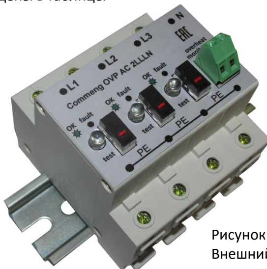
Рисунок 1. Внешний вид

Commeng OVP-2LLLN AC 280/40 устройство защиты от импульсных помех (УЗИП), предназначенное для защиты трехфазных электроустановок и цепей питания переменного тока 220/380 (230/400) В от импульсных перенапряжений. Внешний вид устройства показан на рис.1, функциональная схема на рис.2., основные технические характеристики приведены в таблице.