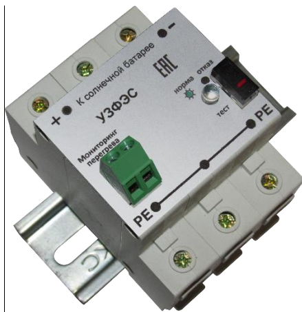
Рисунок 1. Внешний вид УЗИП Комменж УЗФЭС-2 800/40У