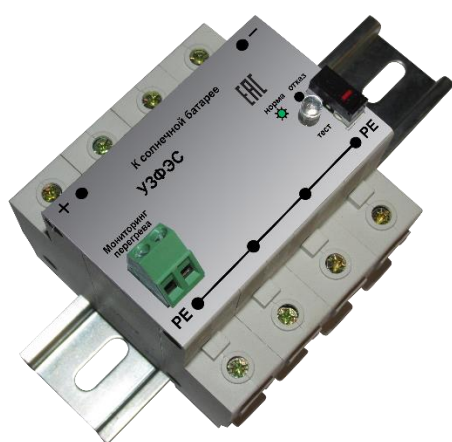
Рисунок 1. Внешний вид УЗИП Комменж УЗФЭС-2 150/80V

Комменж УЗФЭС-2 150/80V применяется в качестве первой ступени защиты, для подавления воздействия частичного электрического тока молнии или индуцированного (наведенного) тока, воздействия магнитного поля. Устанавливаются в непосредственной близости от солнечных батарей, на вводах в здания и контейнеры, в распределительные устройства рядом с инверторами и контроллерами, в распределительных шкафах, ящиках, коробках или боксах. Внешний вид устройства показан на рис.1, электрическая схема на рис.2, основные технические характеристики приведены в таблице.