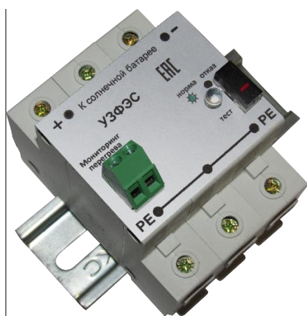
Рисунок 1. Внешний вид УЗИП Комменж УЗФЭС-2 150/40У