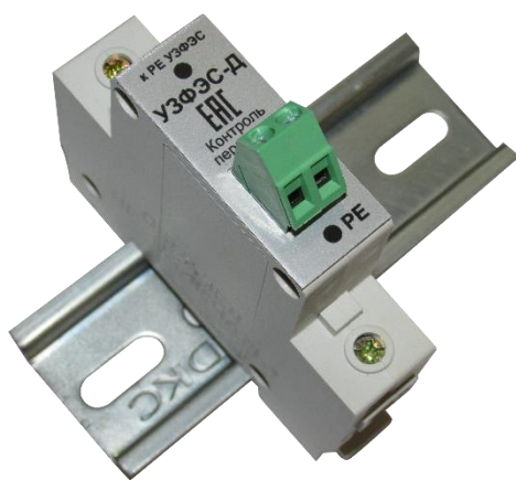
Рисунок 1. Внешний вид добавочного УЗИП Комменж УЗФЭС-Д 75/40

Комменж УЗФЭС-Д 75/40 применяется в качестве первой ступени защиты совместно с УЗФЭС-2 II класса испытания, для подавления воздействия частичного электрического тока молнии или индуцированного (наведенного) тока, воздействия магнитного поля. Устанавливаются в непосредственной близости от солнечных батарей, на вводах в здания и контейнеры, в распределительные устройства рядом с инверторами и контроллерами, в распределительных шкафах, ящиках, коробках или боксах. Внешний вид устройства показан на рис.1, электрическая схема на рис.2 и 3, основные технические характеристики приведены в таблице.