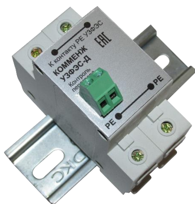
Рисунок 1. Внешний вид добавочного УЗИП Комменж УЗФЭС-Д 150/80

Комменж УЗФЭС-Д 150/80 применяется в качестве первой ступени защиты совместно с УЗФЭС-2 II класса испытания, для подавления воздействия частичного электрического тока молнии или индуцированного (наведенного) тока, воздействия магнитного поля. Устанавливаются в непосредственной близости от солнечных батарей, на вводах в здания и контейнеры, в распределительные устройства рядом с инверторами и контроллерами, в распределительных шкафах, ящиках, коробках или боксах. Внешний вид устройства показан на рис.1, электрическая схема на рис.2 и 3, основные технические характеристики приведены в таблице.