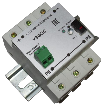
Рисунок 1. Внешний вид УЗИП Комменж УЗФЭС-2 600/40V

Комменж УЗФЭС-2 600/40V применяется в качестве первой ступени защиты, для подавления воздействия частичного электрического тока молнии или индуцированного (наведенного) тока, воздействия магнитного поля. Устанавливаются в непосредственной близости от солнечных батарей, на вводах в здания и контейнеры, в распределительные устройства рядом с инверторами и контроллерами, в распределительных шкафах, ящиках, коробках или боксах. Внешний вид устройства показан на рис.1, электрическая схема на рис.2, основные технические характеристики приведены в таблице.