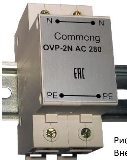
Рисунок 1. Внешний вид

Commeng OVP-2N AC 280/80 устройство защиты от импульсных помех (УЗИП), предназначенное для защиты одно- и трехфазных электроустановок и цепей питания переменного тока 220/380 (230/400)В от импульсных перенапряжений. Внешний вид устройства показан на рис.1, функциональная схема на рис.2., основные технические характеристики приведены в таблице.